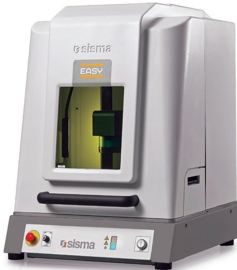
Laser marking system Sistema di marcatura laser